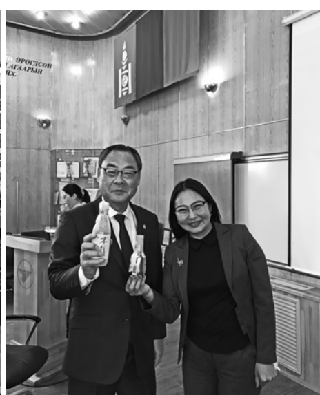
MIATモンゴル航空で銚子産醤油等をPR