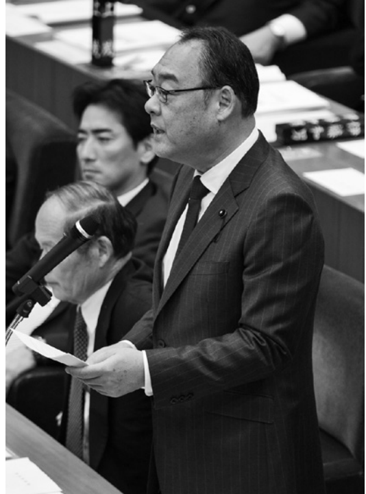
自席から再質問に立ち上がる信田県議