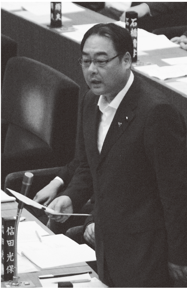
自席から再質問する信田県議

要望 これまで銚子漁港黒生地区の工事費用として、約三百八十八億円が投入されております。早